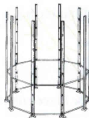
Hela silon monteras snabbt och effektivt av 3 man