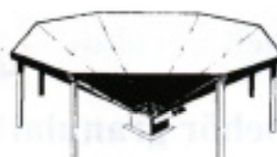
Kon för effektiv tömning av silos